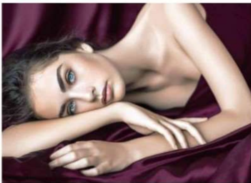
DIBI MILANO Time of Ritual

Cosmoprof WorldWide Bologna, alla 51esima edizione tutte le novità della cosmetica